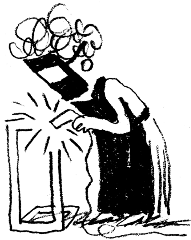
Vsaka od ilustracij, ustvarjenih za Center Rog (pri projektu sta sodelovala še Nejc Prah in Klemen Ilovar), predstavlja enega od proizvodnih laboratorijev centra.

Ja, morda so bili v letu le trije tedni, ko kolumna ni izšla. Po dveh letih je avtorica kolumno zaključila. Bila je pastorka in mama treh otrok, zato je bil tempo zanj prehud. Popolnoma jo razumem, ker je tudi meni odleglo, ko sem izvedel, da se bo končalo, čeprav nisem bil vesel te novice. To je bila dobra preizkušnja vztrajnosti in kondicije, ker sem ob ilustriranju te kolumne vedno delal še vse druge projekte, tudi ilustracije za Center Rog in festival Fabula . Čedalje težje se je bilo vselej spomniti novo metaforo o naravi, obenem pa obdržati elan in se truditi, da bo ilustracija vsak teden dobra. Mislim sem, da bo sčasoma lažje, ker se bom utekel, ampak ni bilo – sem pa seveda zelo hvaležen in vesel, da sem dobil priložnost ilustrirati to kolumno. Na ta projekt sem zelo ponosen.